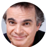
ALEXANDRE JARDIN Écrivain, scénariste et militant associatif