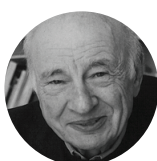
EDGAR MORIN Sociologue et philosophe