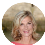
MICHÈLE LAROQUE Comédienne, Scénariste, Productrice