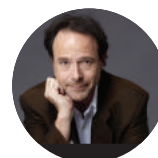
MARC LEVY Présidente Auteur