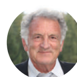
PROFESSEUR RENÉ FRYDMAN Gynécologue-obstétricien, spécialiste de la médecine de la reproduction

Et d'autres nous rejoignent très prochainement !