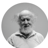
HUBERT REEVES Astrophysicien, communicateur scientifique et écologiste