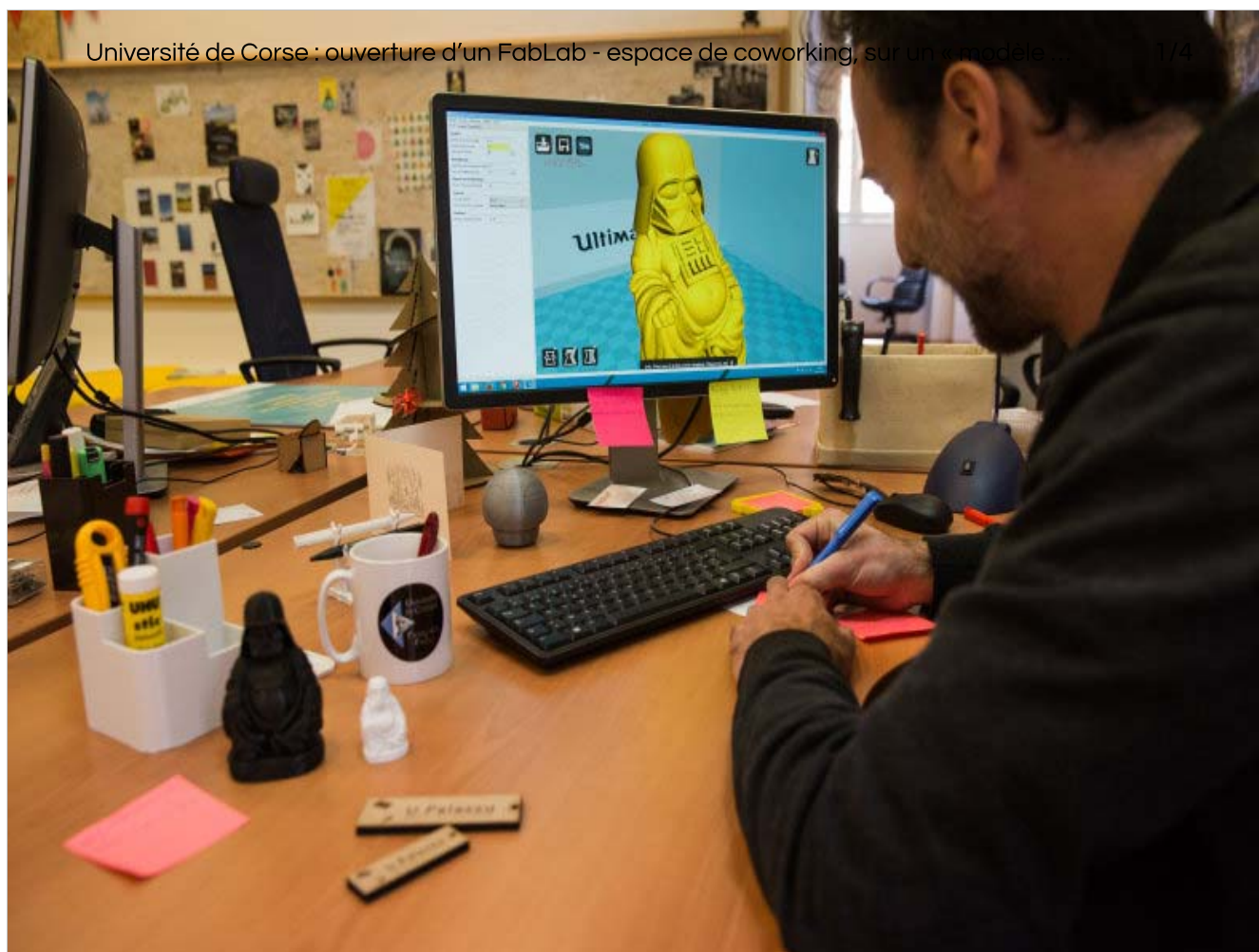
Université de Corse Fab Lab 1 - Tous droits reserves