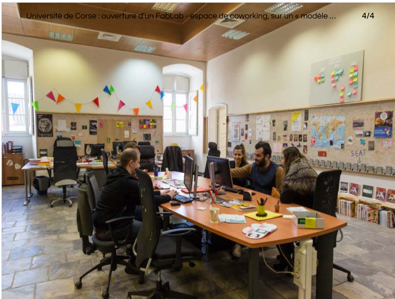
Université de Corse Fab Lab 4 - Tous droits reserves